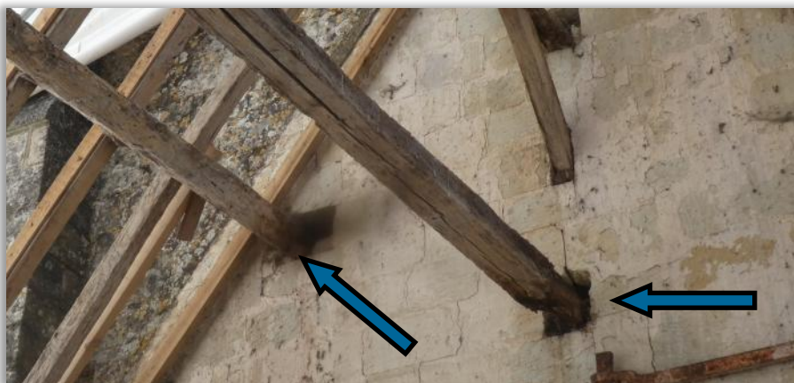
Dégradations prononcées du bois de charpente

L'entreprise Luka Média de Coussay a été mandatée pour effectuer des photos et vidéos pendant les travaux afin de conserver pour les futures générations, un historique des étapes de la restauration.