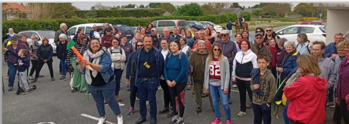
Départ de la marche organisée le 26 avril 2025.