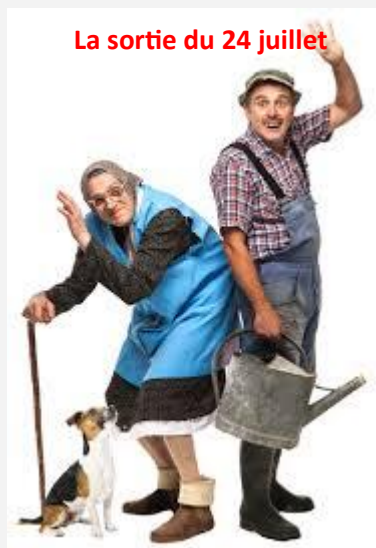
La sortie du 24 juillet