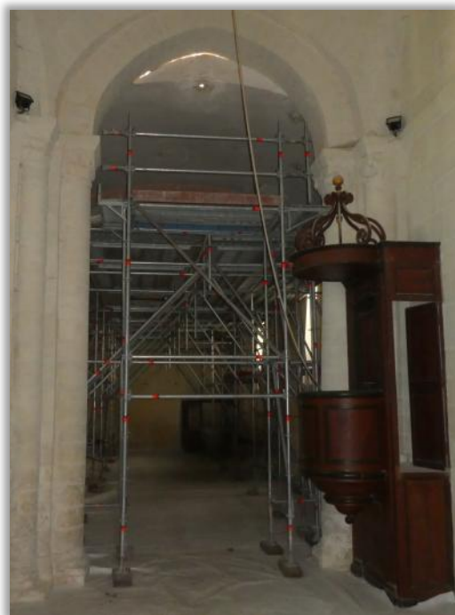
Echafaudage à l'intérieur de l'église